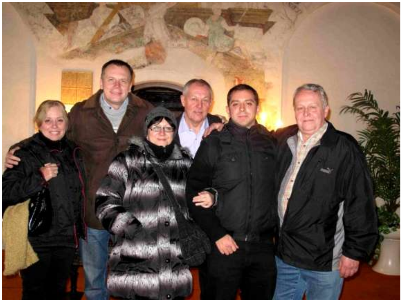
S opavskými rotariány na zámcích v Hradci nad Moravicí, Raduni a Litultovicích